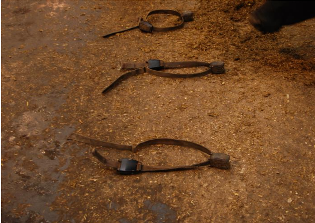
Halsremme med transpondere