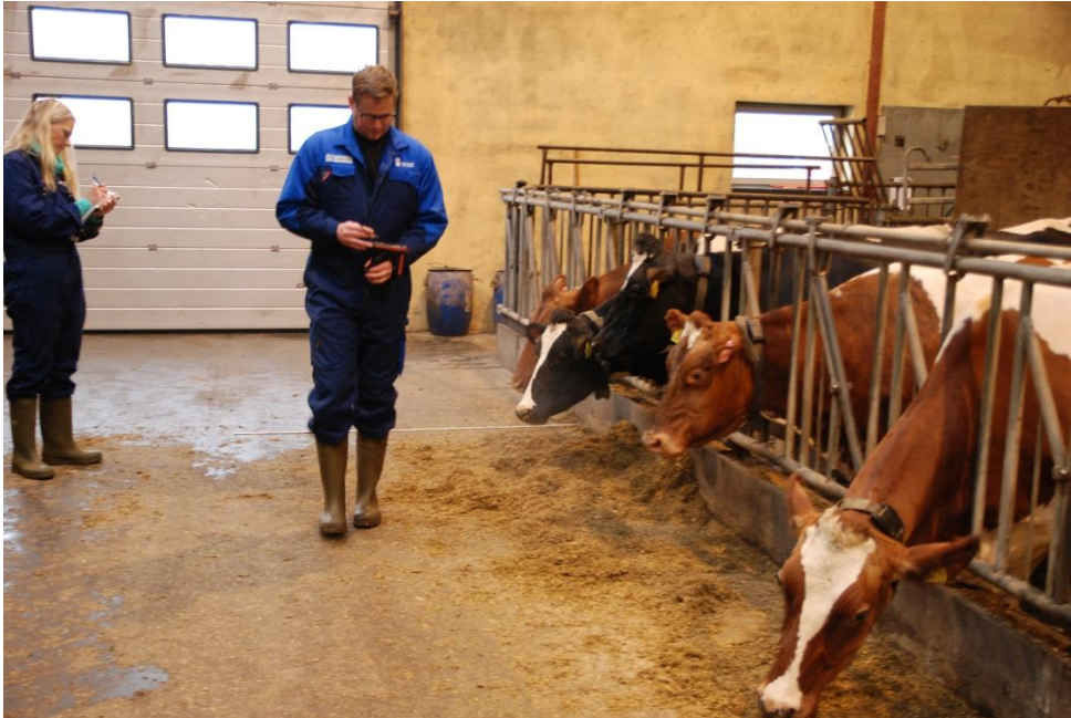
Aflæsning af øremærker 1,5 m fra fanggitterkant. Illustrerer, hvordan myndigheder, landmænd og andre kan anvende scannere uden nærkontakt til dyrene.

Øremærker med UHF testet på 5 køer. Øremærker blev placeret på køernes allerede eksisterende øremærker og aflæst med scanner i forskellige arbejdsituationer.