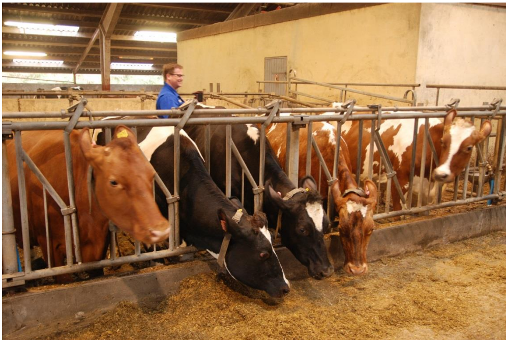
Scanning af øremærker bagfra, herved undgås at man skal gå op mellem dyrene