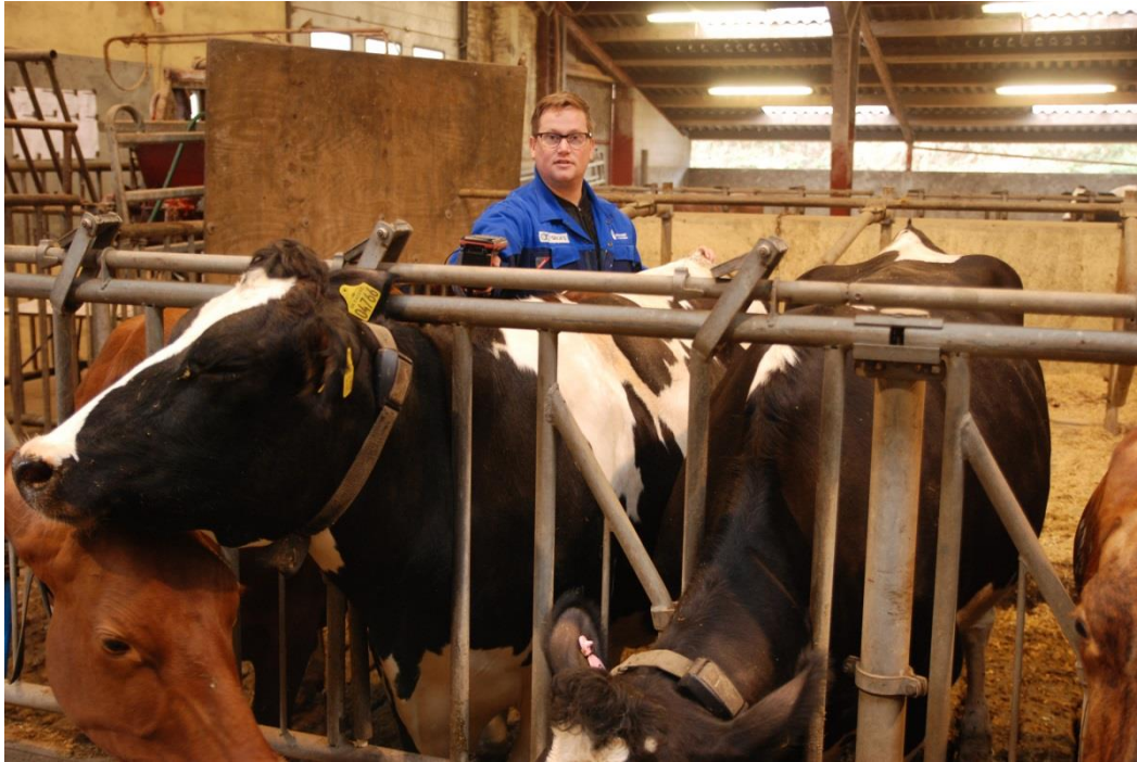
Scanning af øremærker bagfra